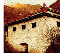
The "Temple Of Miraculous Fire" at Muktinath, Nepal. Photo by Ken Street (November 1979).

[For more on this subject, please read our tract The Temple Of Miraculous Fire. ]